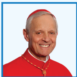
Cardinal Donald Wuerl

Visita Washington. Vive la experiencia de Cracovia. Encuentra a Cristo.